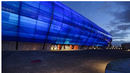
Wat we doen