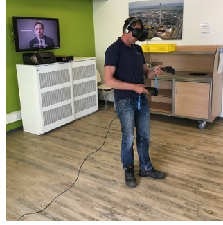
VR Safety Training